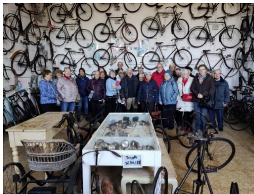
Visite du château de Montfleury et sa plus grande collection de vélos à Avressieux