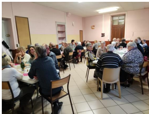
Tirage des Rois